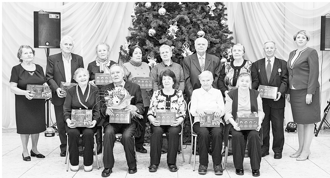
Каждый ветеран-юбиляр получил памятный подарок

Традиционное мероприятие для ветеранов с говорящим названием «Спасибо за труд!» состоялось 19 декабря в ДК «Бумажник». На этот раз добрые слова и поздравления были адресованы тем, кто проработал на бумкомбинате более тридцати лет и отметил в этом году свой личный славный юбилей.