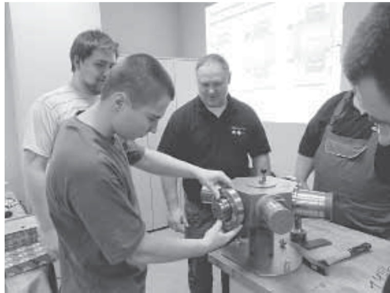
Демонстрация и упражнение в монтаже цилиндрического роликоподшипника.

В последние дни декабря ушедшего года, побывав на семинаре «Обращение с подшипниками качения», 25 слушателей — работников нашего предприятия точно поняли, что в этом тонком деле важно быть ангажированными с точки зрения знаний.