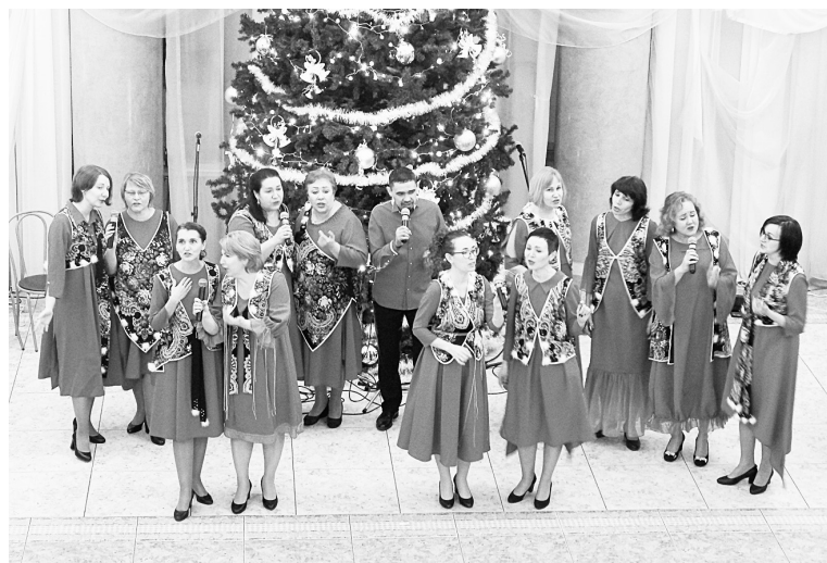
Ансамбль бумажников «Апрель»