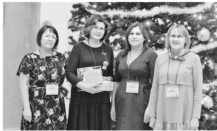
«Бумажник» поздравили коллеги из газеты «Кочёвская жизнь»