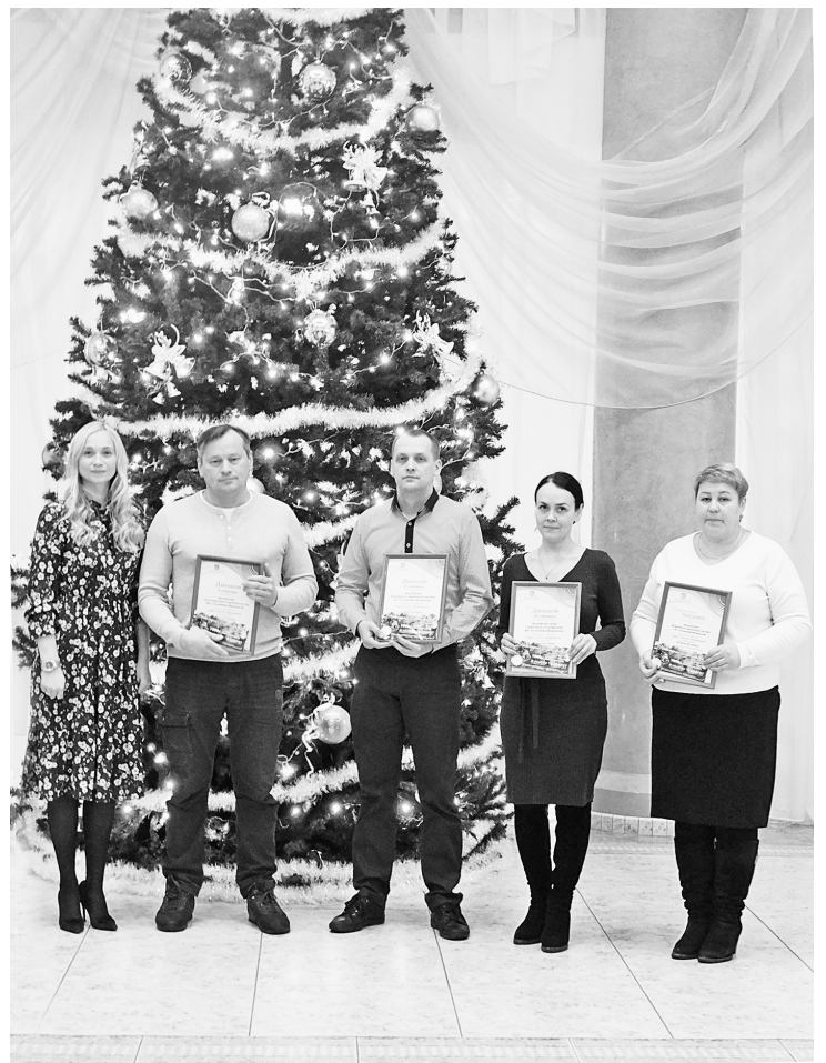
Обладатели наград в номинации «Открытая дверь»