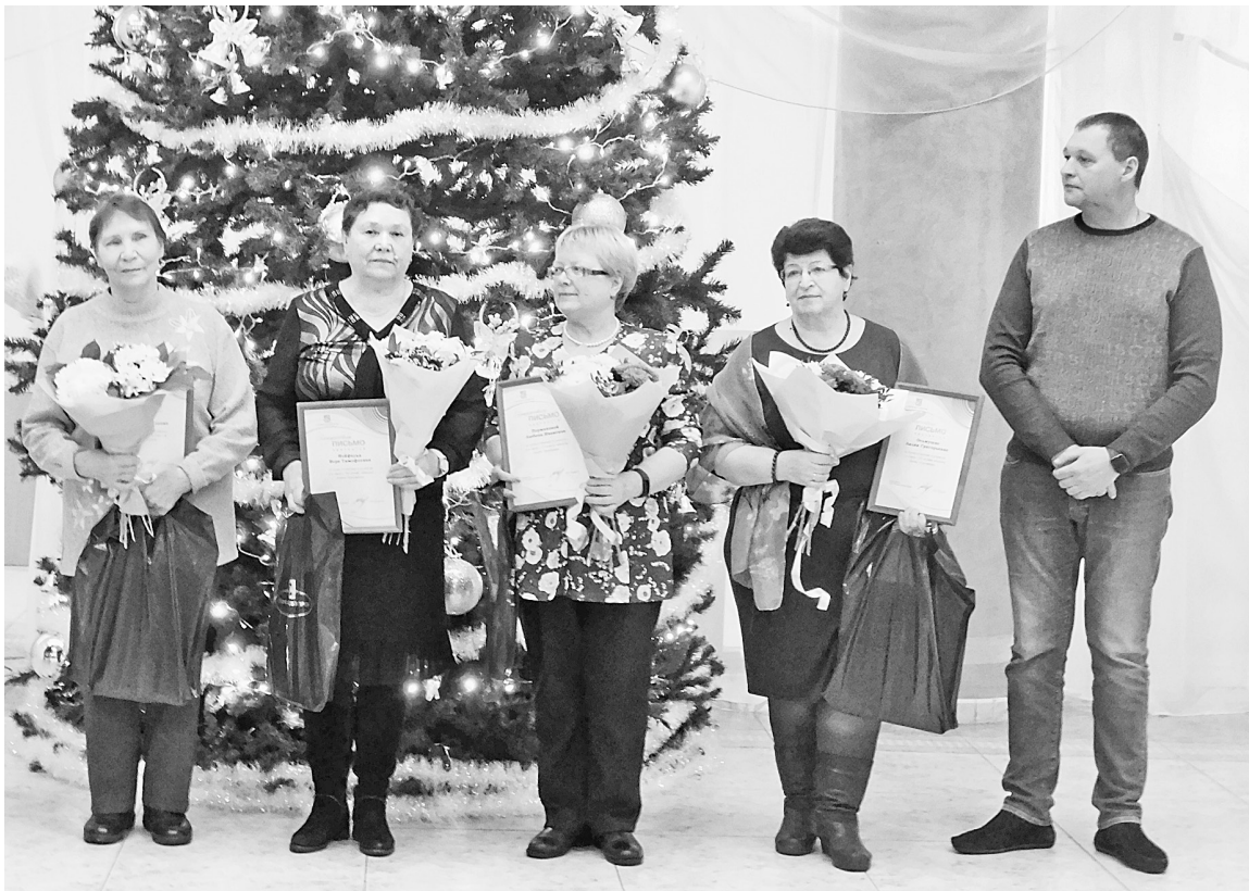
Благодарственные письма были вручены полиграфистам заводской, ставшей корпоративной, газеты «Бумажник». Непростому делу создания газеты многие из них отдали десятки лет