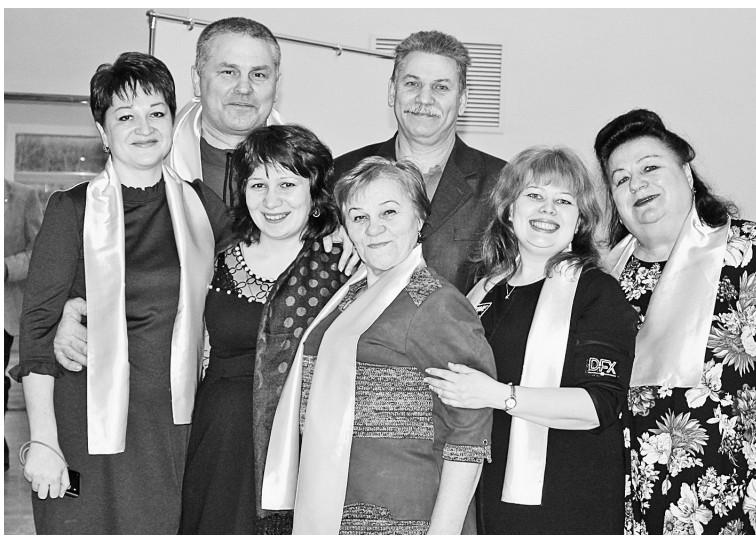
Творческие люди Соликамска и лировцы

Сегодня клуб «Лиры» объединяет более 50 человек. Это и талантливая молодёжь, и увлечённые творчеством люди среднего возраста, и неординар-