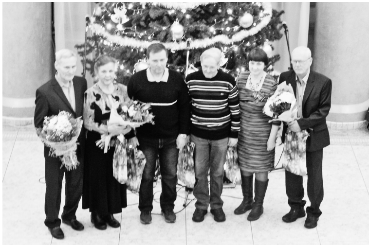
Юбиляры, продолжающие трудовую деятельность

Памятные подарки за вклад в развитие предприятия получили ветераны, отметившие своё семидесятилетие. Приятно отметить, что все они полны сил и энергии. Среди них