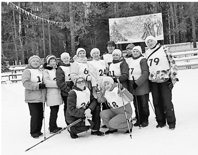
Команда ветеранов АО «Соликамскбумпром» и ООО «Соликамская ТЭЦ»

В течение двух дней 12 и 13 декабря почти 60 участников, допущенных к состязаниям медиками, выполняли большую программу спортивных видов: