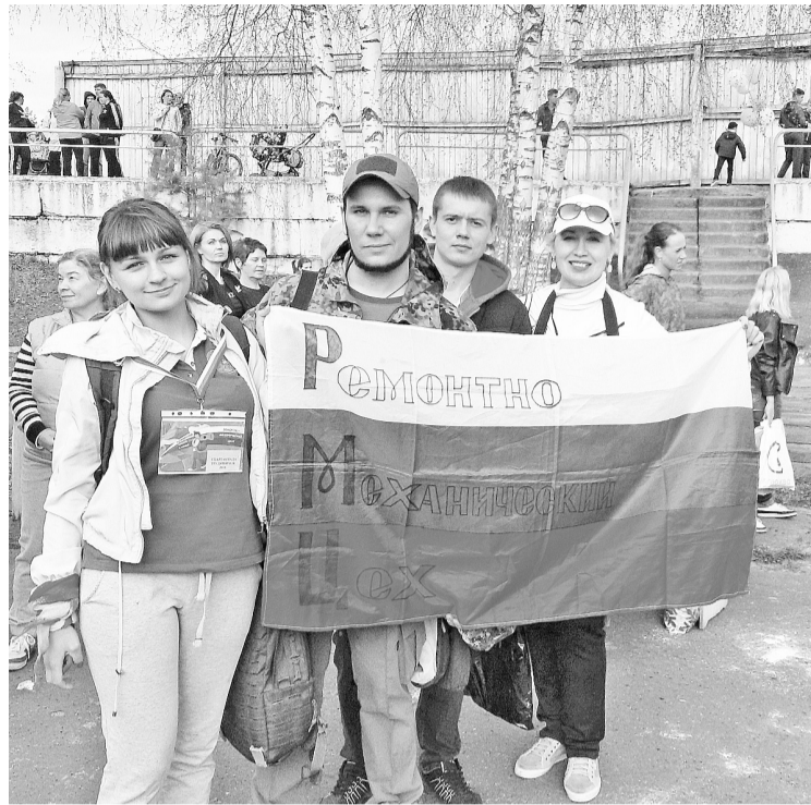
Преданные болельщики команды ремонтно-механического цеха