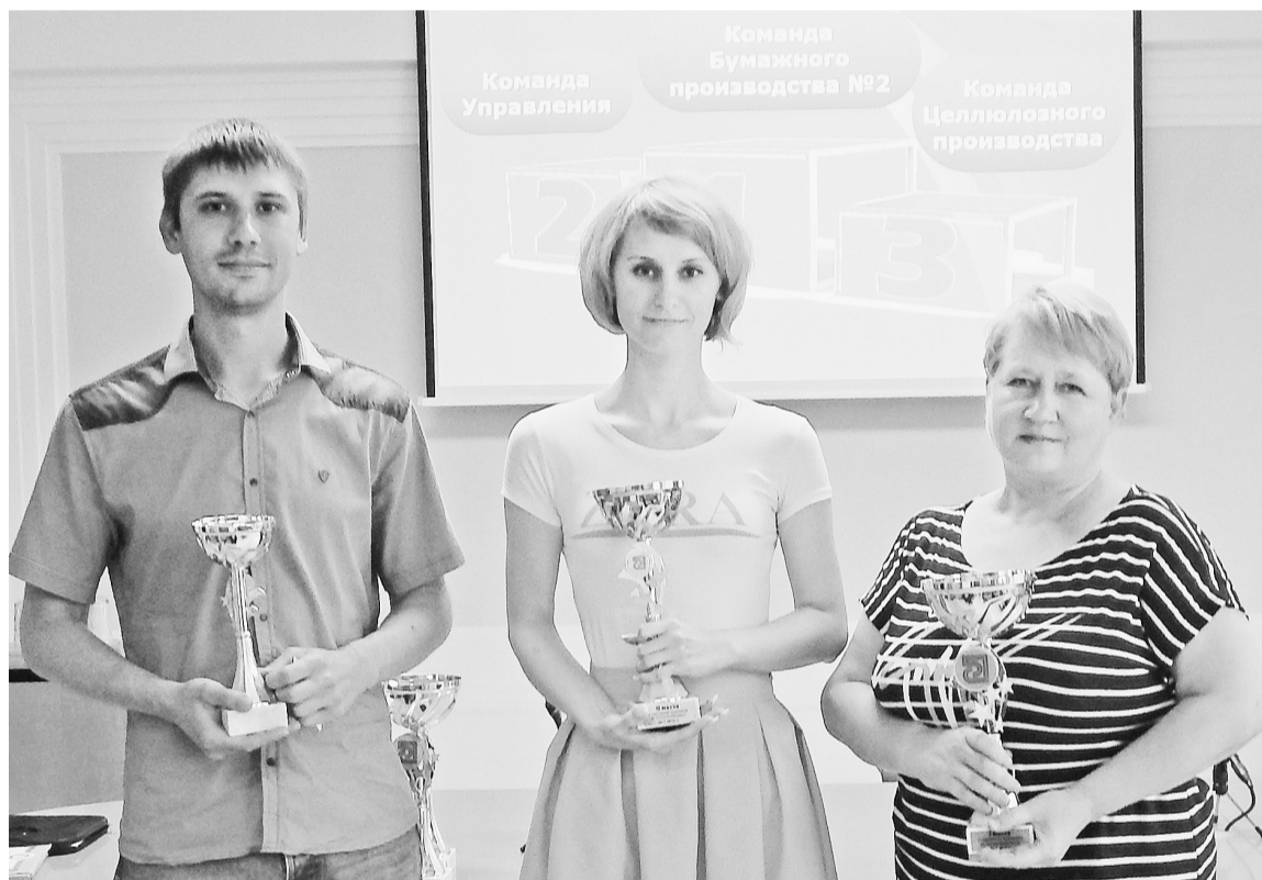
Победители III Спартакиады трудящихся АО «Соликамскбумпром» в первой группе