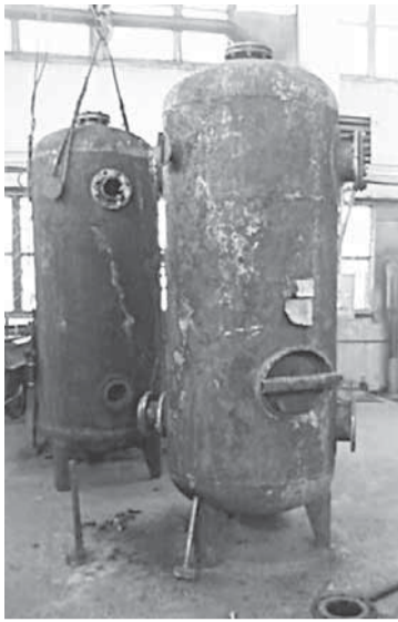
А вот так демонтированные в отбельно-сушильном цехе адсорберы выглядели до того, как за них взялись работники ЦВС.

Еще в декабре прошлого года работники цеха демонтировали адсорберы в отбельно-сушильном, очистили их, специалистами ЛТДО произвели необходимые замеры. Толщина стенок аппаратов изменилась крайне мало.