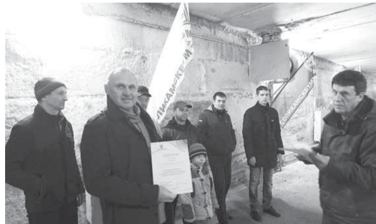
Лидер командного первенства АТЦ.

На стадионе «Бумажник» состоялись соревнования по стрельбе из пневматического оружия, посвященные 70-летию со дня Великой Победы. Бумажники приняли активное участие: 47 человек пытались попасть в десятку.