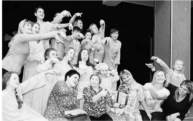
У кого тут юбилей?

Когда я начала работать с детьми, они вышли для меня на первый план. Почему? Например, в группе 15 человек, а в пьесе ролей вполтину меньше. И я начинаю выдумывать роли. Тех, кто помладше, ввожу в спектакли старшей группы. Ведь ребят