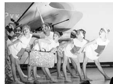
«Чемоданное настроение». Студия танца «Каприз»