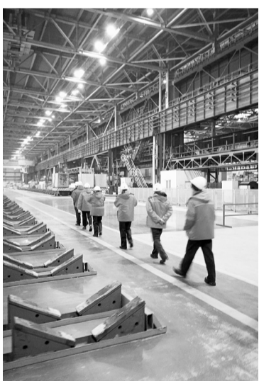
По туристской тропе

Вообще, на Магнитогорском металлургическом комбинате проводятся экскурсии разной тематики по семи маршрутам. На сегодняшний день посредством экскурсий с предприятием познакомилось почти 19 тысяч человек.