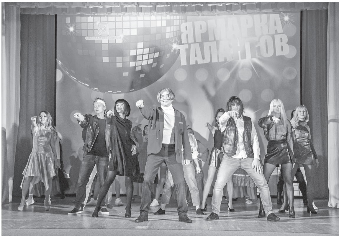
Общий танец участников и организаторов конкурса «Ярмарка талантов-2022»

О! Кто это? Яркая пара, разодетая по моде девяностых, объявляет о начале конкурсной программы и представляет жюри. Тут тоже всё неспроста: открывают неизвестные факты из жизни членов конкурсной комиссии всё тех же девяностых, а о ком идёт речь, надо догадаться! При