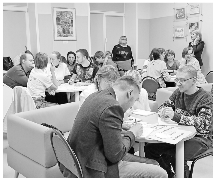
Команды «Энергия поколений» и «Профбум» на игре (слева направо)