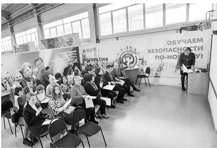
Тема занятия — «Безопасный маршрут»