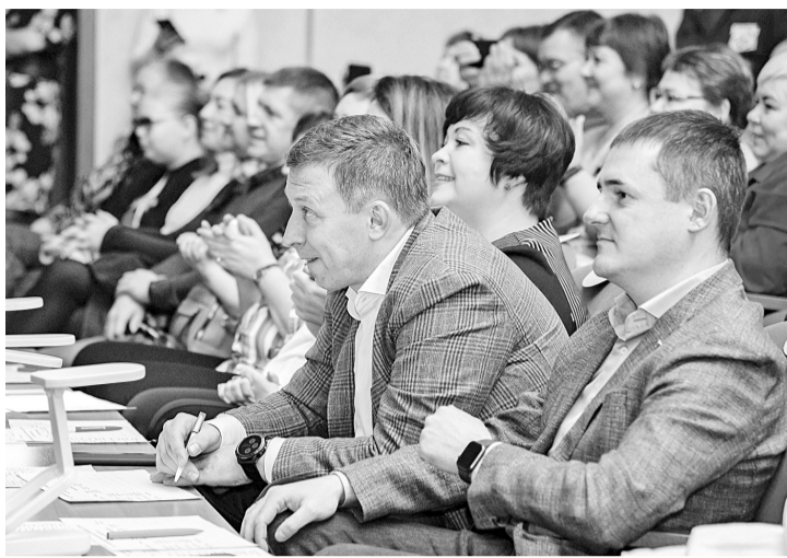
Жюри конкурса заинтриговано не меньше зрителей

Ведущие вновь приглашают всех в зрительный зал. Церемония награждения. Фотографии с популярными исполнителями