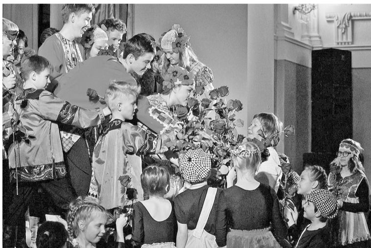
Переменовцы готовы подарить любимому режиссёру-педагогу миллионы алых роз

«Перемена» продолжила свой творческий отчёт стихами, песня-