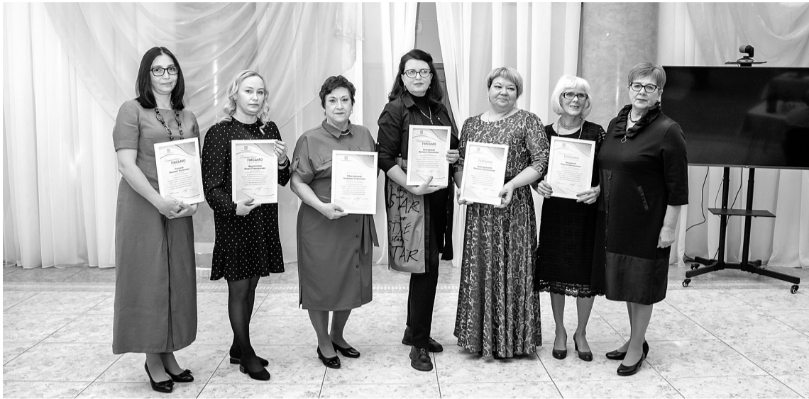
Награждённые Благодарственными письмами АО «Соликамскбумпром»

9 декабря на праздничном мероприятии, посвящённом 80-летию юбилею медицинской службы соликамских бумажников, прошла торжественная церемония награждения лучших работников поликлиники АО «Соликамскбумпром».