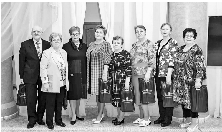
На празднике чествовали ветеранов медицинской службы