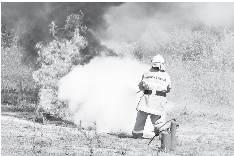
Самый горячий и зрелищный этап эстафеты

— АО «Соликамскбумпром» — единственное предприятие в крае, которое проводит такие соревнования. И это очень важно, поскольку только так можно отработать действия при пожаре. Стоит отметить, что в этом году больше стало теоретических ошибок. Из практических этапов наиболее сложными оказались третий и четвёртый.