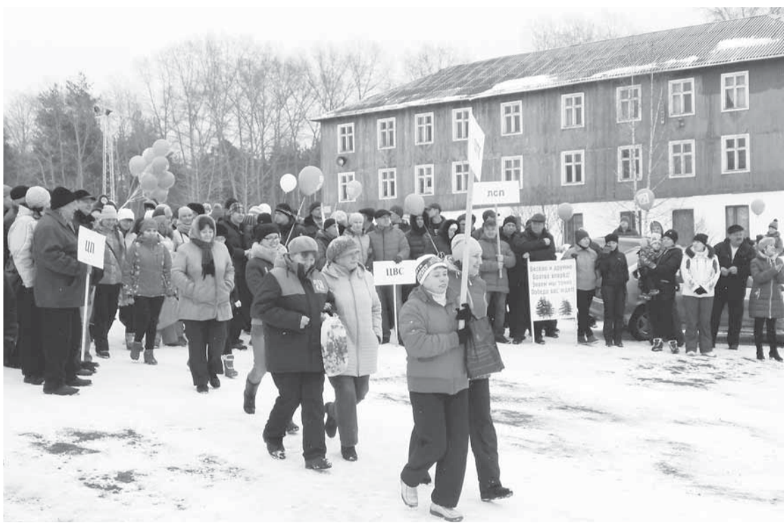
Команды торопятся на построение.

ЗВУЧИТ МУЗЫКА. РАЗВЕВАЮТСЯ ФЛАГИ. ЭМБЛЕМА СПАРТАКИАДЫ ТРУДЯЩИХСЯ СОЛИКАМСКБУМПРОМ ЗОВЁТ К ПОБЕДЕ. НА СТАДИОНЕ 12 МАРТА ОСОБЕННО МНОГОЛЮДНО. ПРАЗДНИК «ЗИМНИЕ ЗАБАВЫ» ОБЪЕДИНИЛ САМЫХ СПОРТИВНЫХ, АКТИВНЫХ И СМЕЛЫХ РАБОТНИКОВ НАШЕГО ПРЕДПРИЯТИЯ.