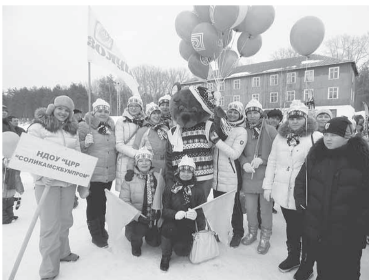
Команды детских садов. «Победить помогут сплочённость, здоровое питание и любовь к спорту!»

Символом праздника стал Мишка из детских садов НДОУ «ЦРР «Соликамскбумпром».