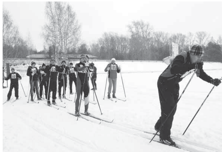
За секунду до старта.

На поле стадиона «Бумажник» к лыжным гонкам были готовы 50 работников предприятия. Заряд бодрости, соревновательный дух, витающий в воздухе, некоторых болельщиков превратил в участников гонки. Решили участвовать: взяли лыжи в прокат и вперёд! Женщин, отважившихся преодолеть