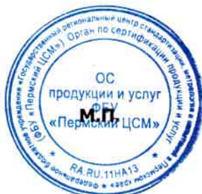
Схема сертификации 1с